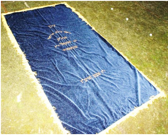
ציון הרה"ק זי"ע בקאזמיר - נמצא לאחרונה ע"י צאצאיו שליט"א

מתוך הספר 'מאמר יחזקאל' - ליקוטים מדברי תורתו